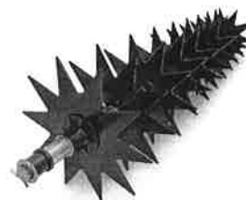
PROVZDUŠŇOVAČ 586 63 69-01