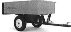
VOZÍK 275 501 00 82-01