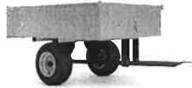
VOZÍK PROFI 953 51 17-02