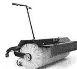
ROTAČNÍ KARTÁČ HUSQVARNA RC-SERIES 593 02 43-01