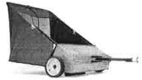
SBĚRNÝ VOZÍK NA TRÁVU, 112 CM 586 63 65-01