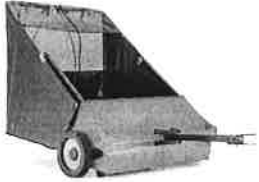
SBĚRNÝ VOZÍK NA TRÁVU, 91 CM 582 71 99-01