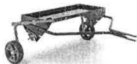
NOSNÝ RÁM PŘÍSLUŠENSTVÍ 586 63 72-01