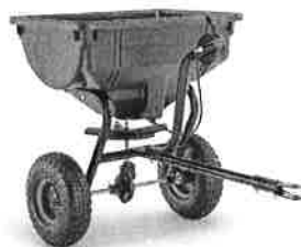
ROZMETADLO SPREADER 30 589 40 93-01