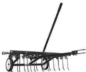
ODMECHOVAČ 586 63 66-01