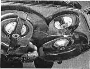
ŽACÍ ÚSTROJÍ COMBI 112 PRO RIDERY 967 62 90-01