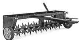
PROVZDUŠŇOVAČ 586 63 67-02