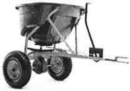
ROZMETADLO SPREADER 75 967 02 72-01