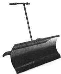
SNĚHOVÁ RADLICE K RIDERŮM HUSQVARNA RC-SERIES 593 02 50-01