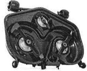
ŽACÍ ÚSTROJÍ COMBI 103 PRO RIDERY 967 62 89-01