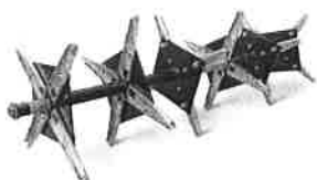
PROVZDUŠŇOVAČ 588 21 27-01