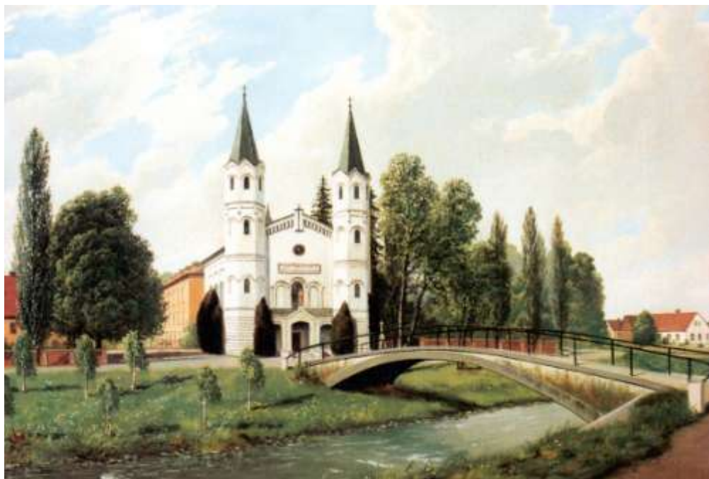
Historická pohlednice kostela