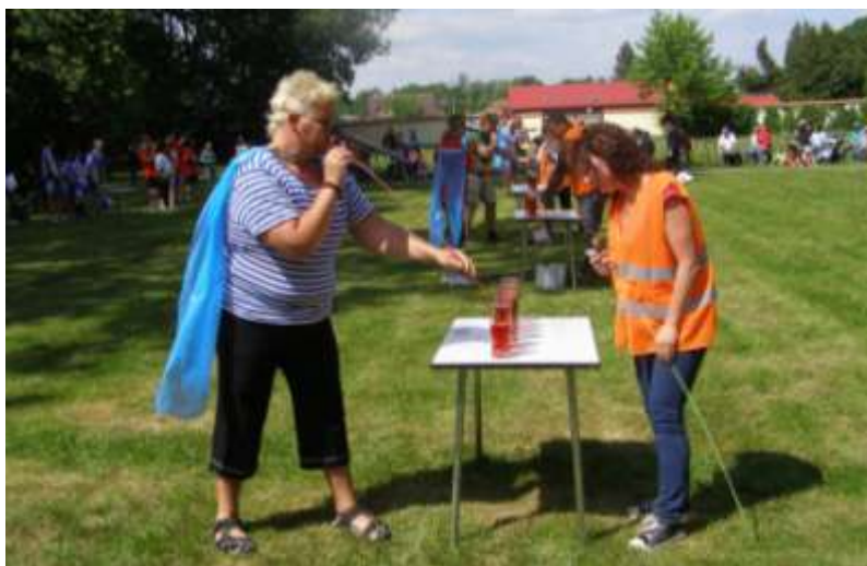
II. kunínské hry bez hranic