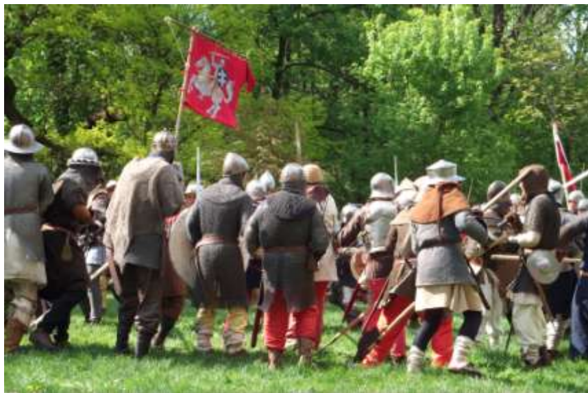
Písně Nibelungů – bitva v zámeckém parku