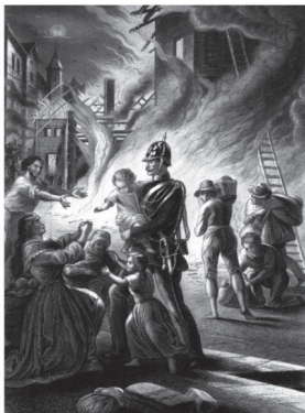
Četnická kasárna v Praze