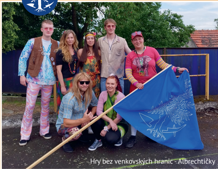
Hry bez venkovských hranic - Albrechtický